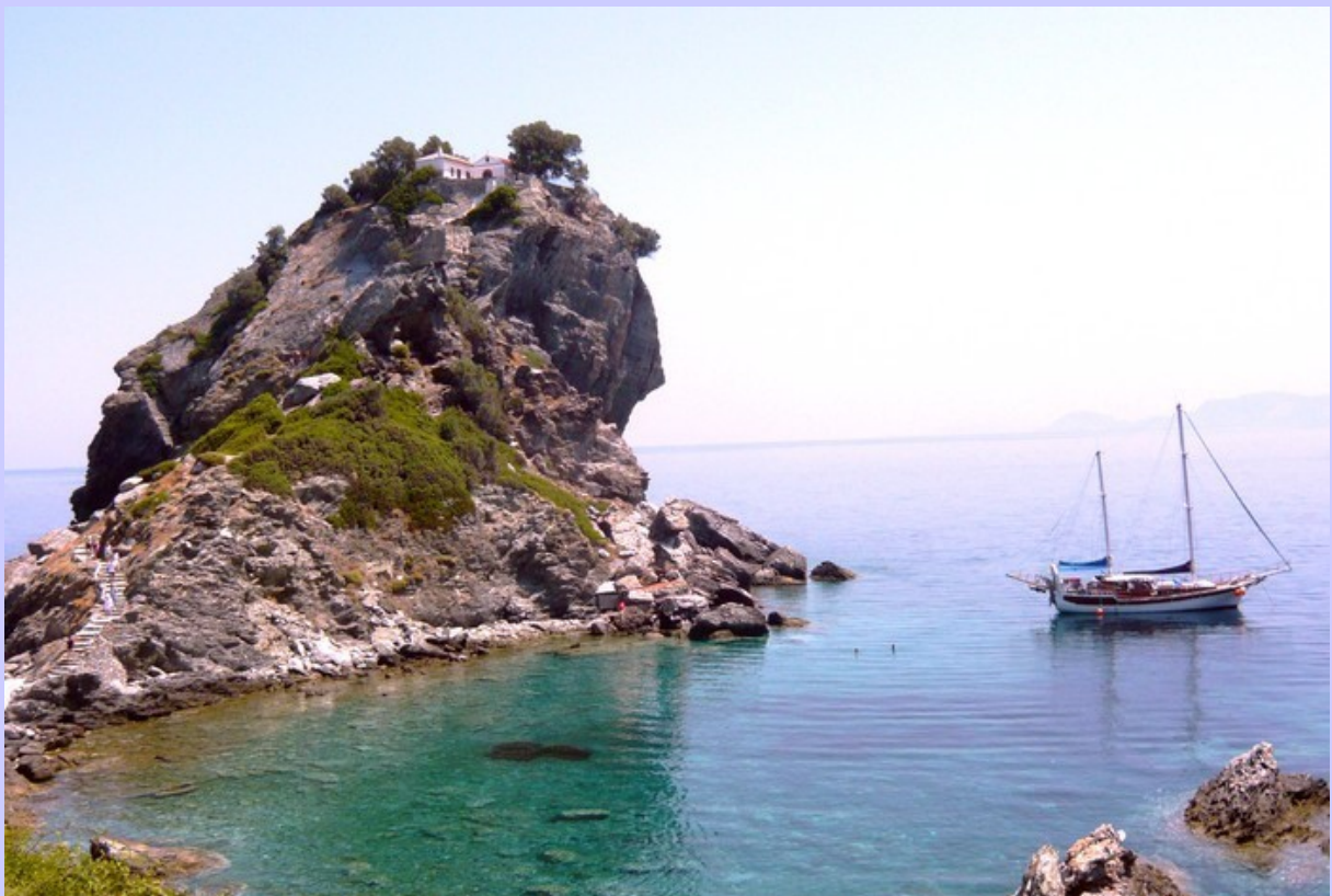
L'ANATOLIE à l'ancre sous l'église de "Mamma mia"

En demi-pension, pas de facturation au bar : boissons de base à libre disposition et possibilité d'amener ou acheter vos propres bouteilles. Le petit-déjeuner et un repas copieux à base de produits frais vous sont servis en demi-pension (apéritif et vins locaux compris).